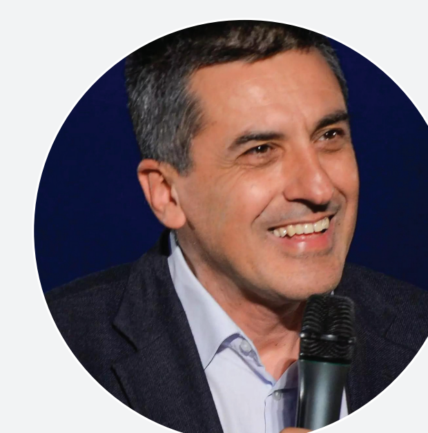
Δημήτρης Κουρέτας Περιφερειάρχης Θεσσαλίας