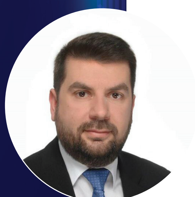
Μιχαήλ Φέκκας Αντιπρόεδρος Επιτροπής Κεφαλαιαγοράς «Προϋποθέσεις εισαγωγής των ΜμΕ στην Εναλλακτική Αγορά, Οφέλη και Προοπτικές, Ρυθμιστικό πλαίσιο που διέπει τις κεφαλαιαγορές»